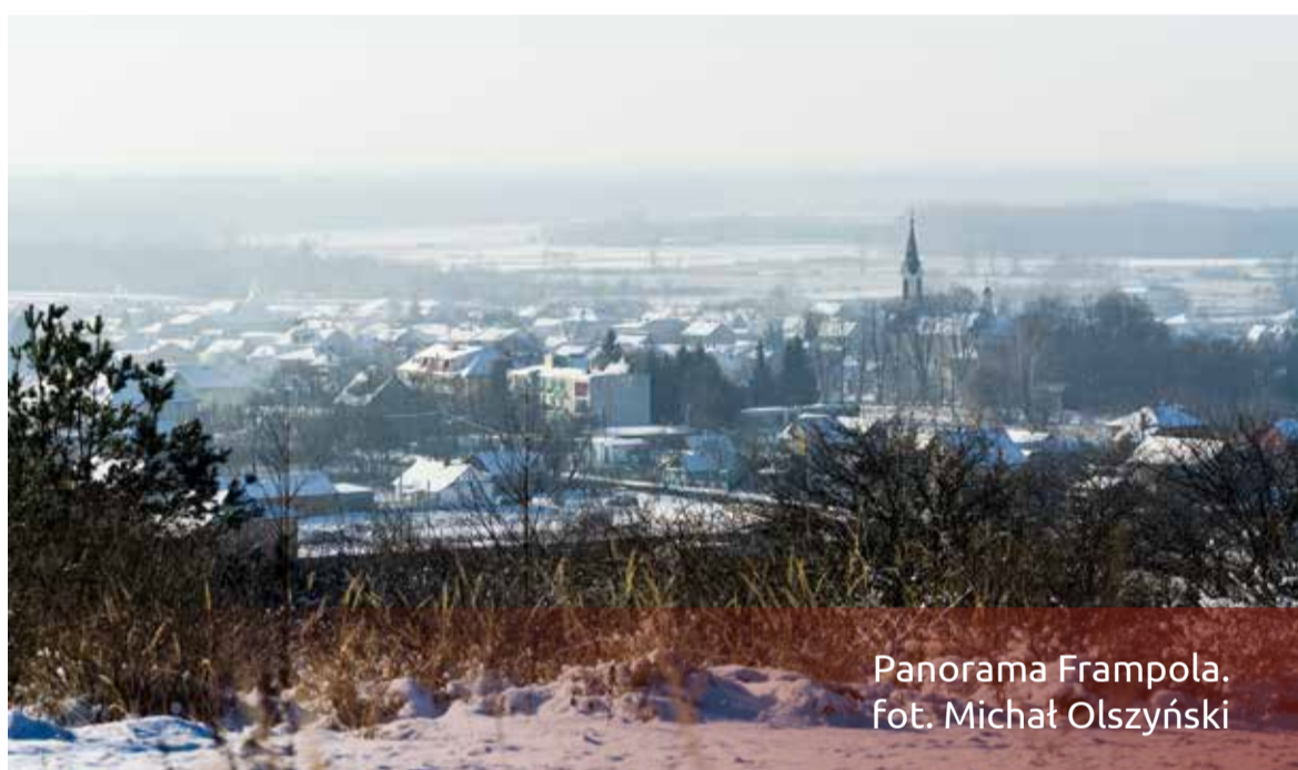
Panorama Frampola. Fot. Michał Olszyński

Gmina Frampol Droga łącząca dwa powiaty – pomiędzy Pulczynowem, a Trzęsinami. Fot. Michał Olszyński