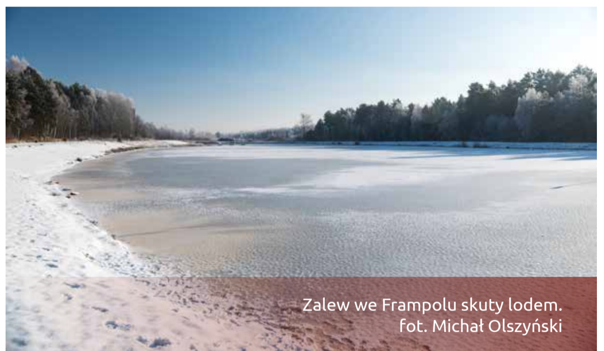
Zalew we Frampolu skuty lodem.